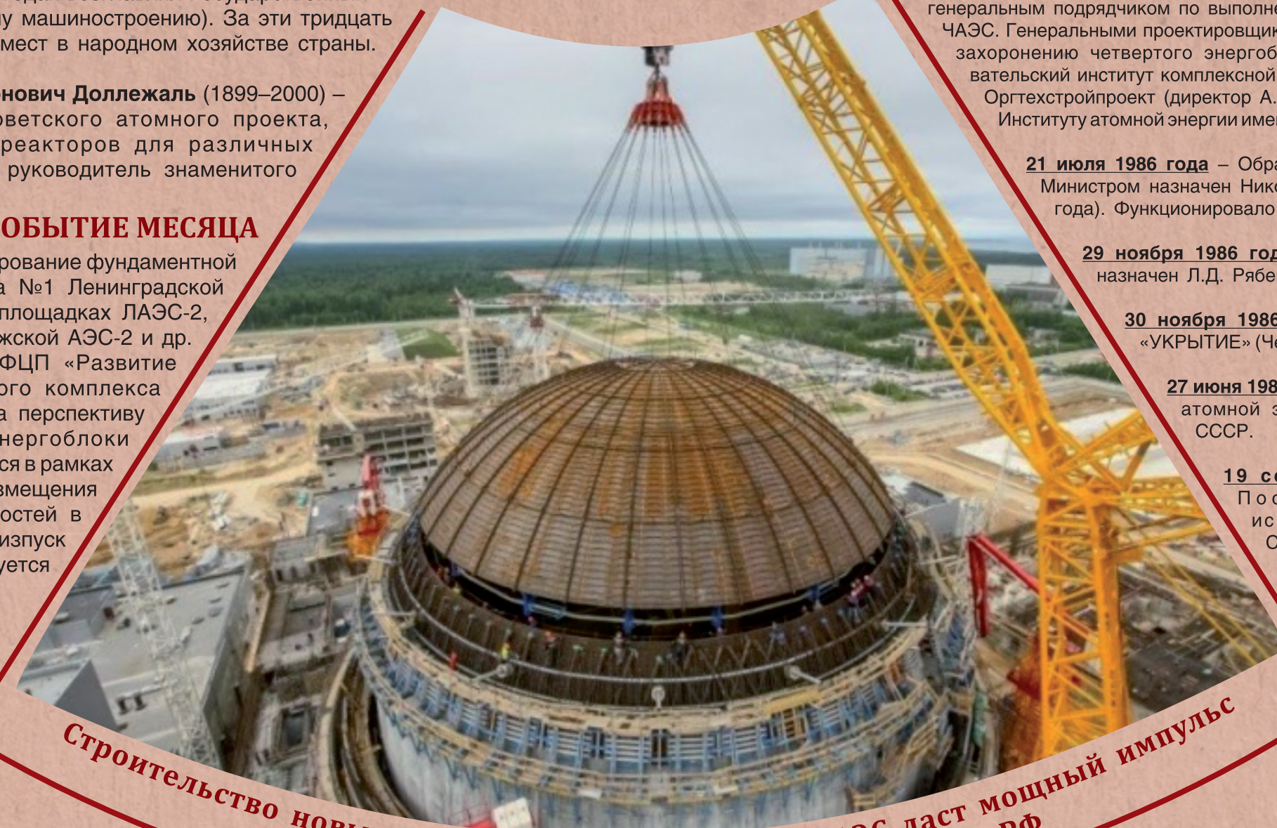
Строительство новых, современных и надежных АЭС даст мощный импульс социально-экономическому развитию регионов РФ

25 октября 2008 года – началось бетонирование фундаментной плиты здания реактора энергоблока №1 Ленинградской АЭС-2. Заливка первого бетона на площадках ЛАЭС-2, а в июне 2008 года на Нововоронежской АЭС-2 и др. явилось следствием принятой ФЦП «Развитие атомного энергопромышленного комплекса России на 2007–2010 гг. и на перспективу до 2015 года». Новые энергоблоки атомных станций возводятся в рамках генеральной схемы размещения генерирующих мощностей в РФ до 2020 г. Физпуск ЛАЭС-2 планируется в 2015 г.